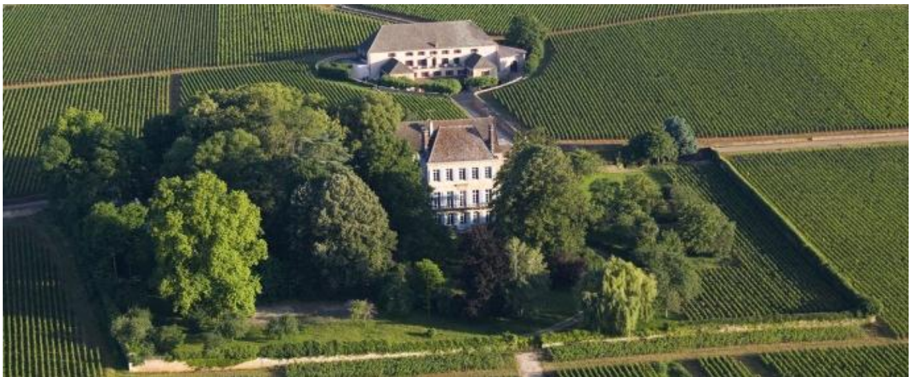
La cuverie et le château Corton Grancey